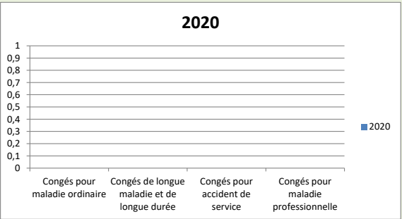
Nombre de jours d'arrêts pris pour :