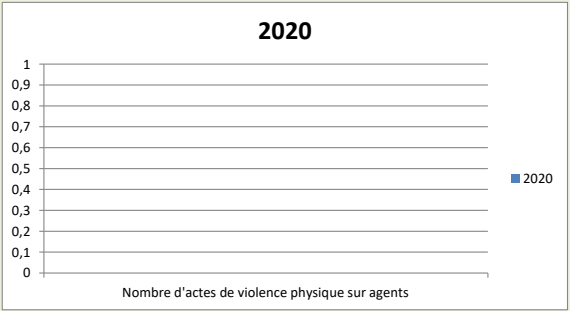
Nombre d'actes de violence physique sur les agents :