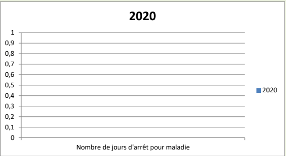
Nombre de jours d'arrêts pour maladie :