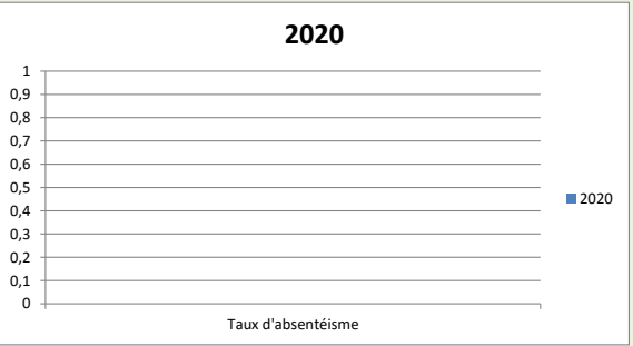
Taux d'absentéisme (en %) :