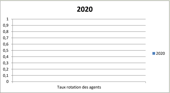
Taux de rotation des agents (en %) :