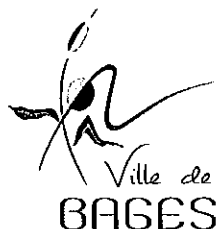
TABLEAU ANNUEL D'AVANCEMENT DE GRADE Rédacteur principal de 2 ème classe