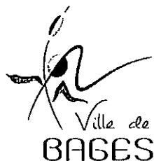
TABLEAU ANNUEL D'AVANCEMENT DE GRADE Rédacteur principal de 1 ère classe