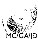
TABLEAU ANNUEL D'AVANCEMENT AU GRADE D'ADJOINT ADMINISTRATIF PRINCIPAL DE 2 ème CLASSE Arrêté n°3/2023

Le Maire de la commune d'Amélie-les-Bains-Palalda-Montalba,