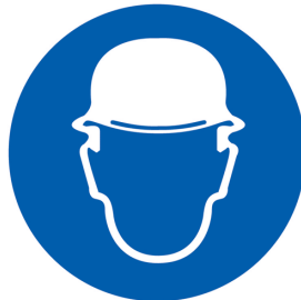
Figure 3 : Casque isolant