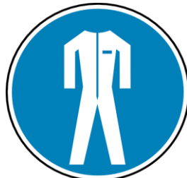
Figure 5 : Tenue de travail adaptée