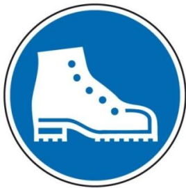
Figure 2 : Chaussures de sécurité isolantes