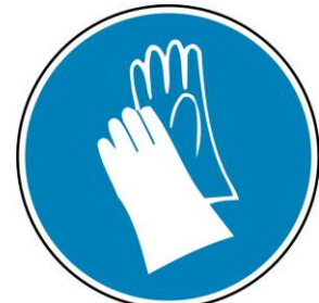
Figure 4 : Gants de sécurité