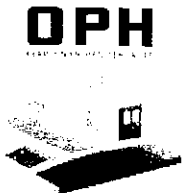
Tableau annuel d'avancement au Grade d'Adjoint Technique principal 1 ère classe