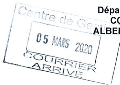
TABLEAU D'AVANCEMENT ANNUEL au Grade d'AGENT DE MAITRISE PRINCIPAL

Le Président de la Communauté de Communes Albères Côte Vermeille Illibérus, Vu le code général des collectivités territoriales, Vu la loi n° 83-634 du 13 juillet 1983 modifiée, portant droits et obligations des fonctionnaires, notamment son article 17, Vu la loi n° 84-53 du 26 janvier 1984 modifiée, portant dispositions statutaires relatives à la Fonction publique territoriale, notamment ses articles 79 et 80, Vu le décret n°2016-1382 du 12 octobre 2016 modifié portant statut particulier du cadre d'emplois des Agents de maîtrise territoriaux, Considérant l'avis favorable rendu par la Commission Administrative Paritaire en séance du 04 mars 2020.