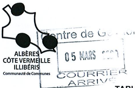
TABLEAU D'AVANCEMENT ANNUEL au Grade d'Opérateur Qualifié des A.P.S

Le Président de la Communauté de Communes Albères Côte Vermeille Illibéris, Vu le code général des collectivités territoriales, Vu la loi n° 83-634 du 13 juillet 1983 modifiée, portant droits et obligations des fonctionnaires, notamment son article 17, Vu la loi n° 84-53 du 26 janvier 1984 modifiée, portant dispositions statutaires relatives à la Fonction publique territoriale, notamment ses articles 79 et 80, Vu le décret n°92-368 du 1 er avril 1992 modifié portant statut particulier du cadre d'emplois des Opérateurs territoriaux des APS, Considérant l'avis favorable rendu par la Commission Administrative Paritaire en séance du 04 mars 2020.