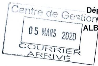
TABLEAU D'AVANCEMENT ANNUEL au Grade d'Adjoint du Patrimoine Principal de 1 ère classe

Le Président de la Communauté de Communes Albères Côte Vermeille Illibéris, Vu le code général des collectivités territoriales, Vu la loi n° 83-634 du 13 juillet 1983 modifiée, portant droits et obligations des fonctionnaires, notamment son article 17, Vu la loi n° 84-53 du 26 janvier 1984 modifiée, portant dispositions statutaires relatives à la Fonction publique territoriale, notamment ses articles 79 et 80, Vu le décret n°2006-1692 du 22 décembre 2006 modifié portant statut particulier du cadre d'emplois des Adjointes du patrimoine territoriaux, Considérant l'avis favorable rendu par la Commission Administrative Paritaire en séance du 4 mars 2020.