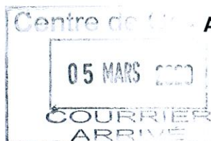
TABLEAU D'AVANCEMENT ANNUEL au Grade d'Attaché Principal

Le Président de la Communauté de Communes Albères Côte Vermeille Illibérès, Vu le code général des collectivités territoriales, Vu la loi n° 83-634 du 13 juillet 1983 modifiée, portant droits et obligations des fonctionnaires, notamment son article 17, Vu la loi n° 84-53 du 26 janvier 1984 modifiée, portant dispositions statutaires relatives à la Fonction publique territoriale, notamment ses articles 79 et 80, Vu le décret n°87-1100 et n°87-1099 du 30 décembre 1987 modifié, portant statut particulier et échelonnement indiciaire du cadre d'emplois des Attachés territoriaux, Considérant l'avis favorable rendu par la Commission Administrative Paritaire en séance du 04 mars 2020.