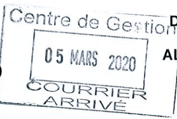
TABLEAU D'AVANCEMENT ANNUEL au Grade d'Adjoint Technique Principal de 1 ère classe

Le Président de la Communauté de Communes Albères Côte Vermeille Illibérès, Vu le code général des collectivités territoriales, Vu la loi n° 83-634 du 13 juillet 1983 modifiée, portant droits et obligations des fonctionnaires, notamment son article 17, Vu la loi n° 84-53 du 26 janvier 1984 modifiée, portant dispositions statutaires relatives à la Fonction publique territoriale, notamment ses articles 79 et 80, Vu le décret n°2006-1691 du 22 décembre 2006 modifié portant statut particulier du cadre d'emplois des Adjointes techniques territoriaux, Considérant l'avis favorable rendu par la Commission Administrative Paritaire en séance du 04 mars 2020.