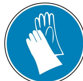
Figure 4 : Gants de sécurité